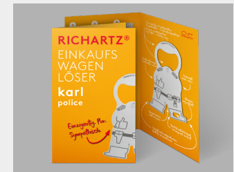
... mit Standardverpackung